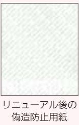
リニューアル後の偽造防止用紙

戸籍証明書用紙デザインリニューアル 窓口で発行する戸籍証明書の偽造防止用紙のデザインをリニューアルしました。旧デザインの在庫がなくなり次第、順次切り替える予定です。