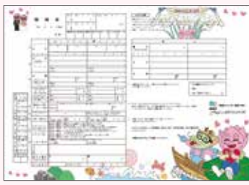
南越前町オリジナル婚姻届