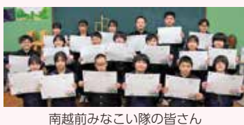
南越前みなこい隊の皆さん

南越前町オリジナル婚姻届作成 南越前みなこい隊の皆さんのアイデアをもとにオリジナル婚姻届を作成しました。オリジナル婚姻届は町ホームページからダウンロードできます。A3用紙に印刷して、ご使用ください。