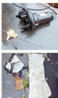
マンホールポンプに詰まっていた異物

下水道施設は、家庭や事業所等から出る汚水が正常に処理されるよう、24時間体制で稼働しています。下水道のマンホールポンプに衣類などの異物が詰まることで、ポンプ故障が発生しています。ポンプが故障するとマンホールから汚水があふれるだけでなく、接続している家庭内の排水口から汚水が逆流することもあります。衣類やマスク、紙おむつ、ウェットティッシュなどは水に溶けません。トイレトペーパー以外のものは流さないようお願いいたします。