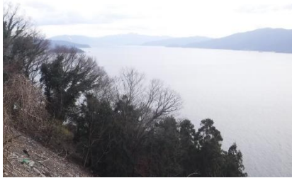
「たこの呼び坂」から敦賀方面を望む