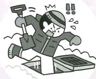
側溝や融雪溝への転落