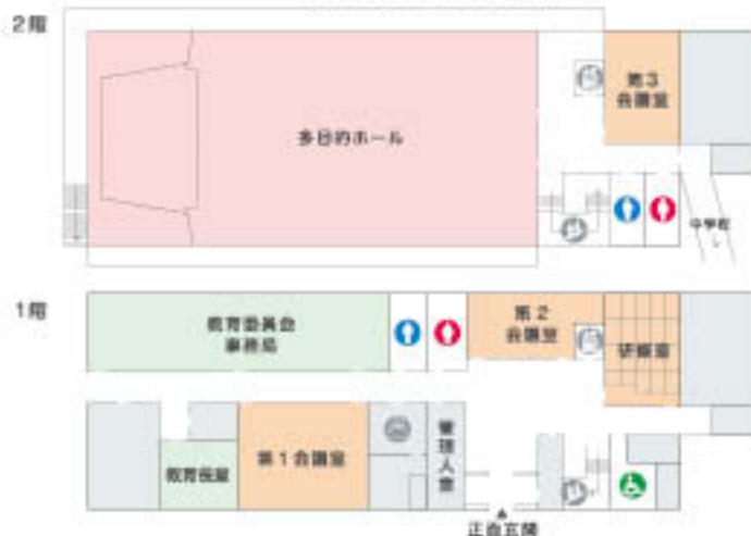
〈南条地区公民館案内図〉

問合せ 教育委員会事務局 ☎ 0778-47-8005 FAX 0778-47-7010