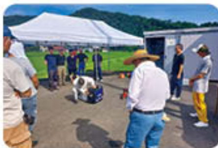
防災研修会の様子