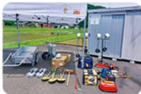
整備された防災資機材・防災倉庫

東谷区では、7月28日(日)に防災研修会を実施し、整備された資機材の使い方を参加者で共有し合い、災害に備える気持ちを高めました。