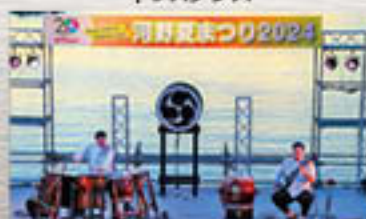
スペシャルライブ