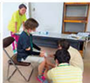
フレイルチェックの様子