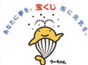
宝くじ助成事業で整備されました