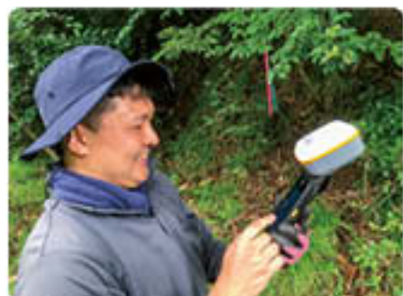
GPSを使って森林の境界を測量している様子

僕は最近、「移住・関係人口の促進」の一環として、南条郡森林組合で林業の体験をさせていただいています。町外の方に向けて林業体験プランを作成して周知し、林業の仕事を体感していただくことが目的です。林業も知れば知るほど奥が深く、日々新たな