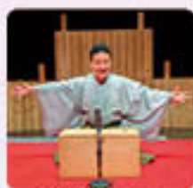
四代目玉田玉秀斎