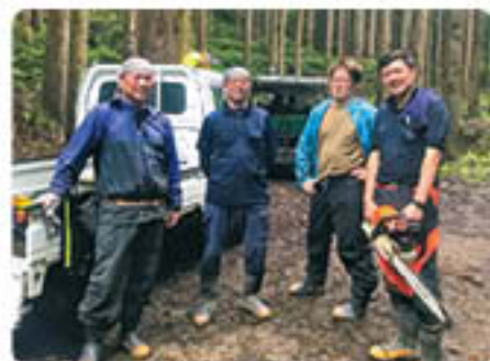
森林組合のみなさんと