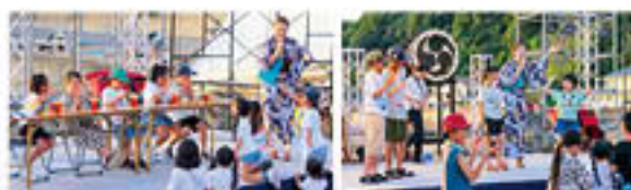
チャレンジステージ かけ氷早食い対決(左) 万歩計フリフリ対決(右)