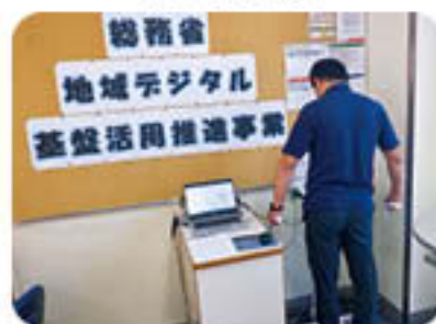
郵便局での測定の様子