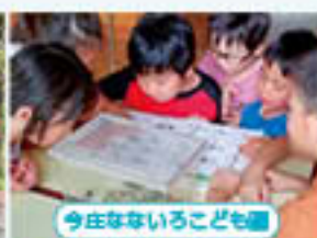
今庄なないるこども園