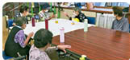
南条保健福祉センター

*会場や日時は、変更となる場合があります。最新の情報は、町民カレンダーなどでご確認ください。