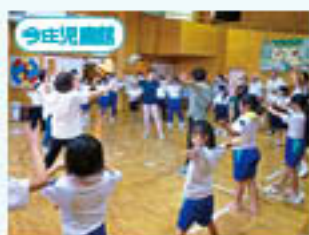
羽根管廻りの練習で地域の文化を体験