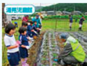
さつまいもの苗植え