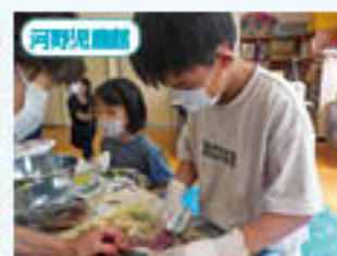
食育教室 魚さばき体験

★放課後児童クラブの新規登録については、11月ごろに各園・各学校を通じてご案内します。