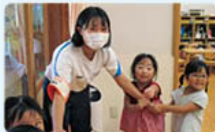
南条こども園 子どもたちの人気者☆