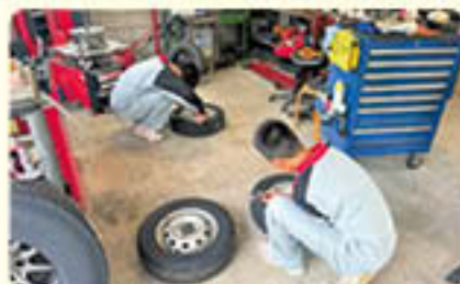
越川端モータース 丁寧に作業をしています☆