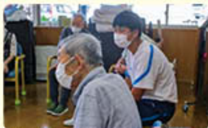
南越町社会福祉協議会 今庄デイサービスセンター 楽しそうに何を話しているのかな？