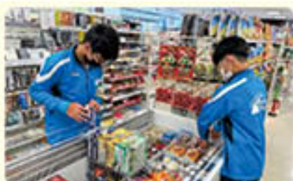
ファミリーマート 河野北前船主通り店 暑い日はアイスがどんどん売れる！