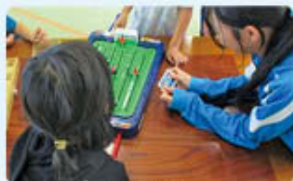
南条児童館 子ども達とゲームに熱中♪