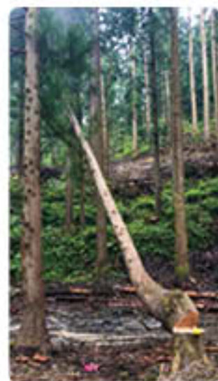
切った木が倒れる瞬間

私としても今後、体験させていただいた内容をもとに体験プランの作成をはじめ、森林組合の活性化に関わるさまざまな活動に取り組んでいきますので、応援よろしくをお願いします！