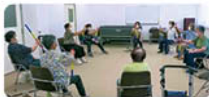
今庄住民センター