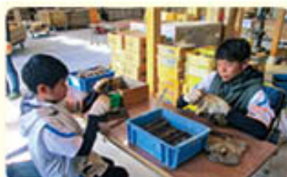
美 K-four いろんな形の工具があるんだな～

「Well Doing」を学年の目標としている生徒たちは、それぞれの事業所様のご指導のもと、この活動を大きな経験として、また一歩成長していくことと期待しています。