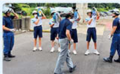
南越消防組合 南消防署 ホースを肩に乗せられるかな？