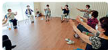
ファミリーマート+ハーツ河野北前船主通り店