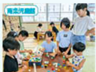
「キャップで大金持ちになろう！」ゲームコーナー

放課後児童クラブは、各児童館で開設しています。それぞれのクラブごとに多彩な活動も実施し、安心して過ごすことができるこどもの居場所となっています。