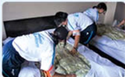
花はず温泉 そまやま ベッドメイク頑張りました！