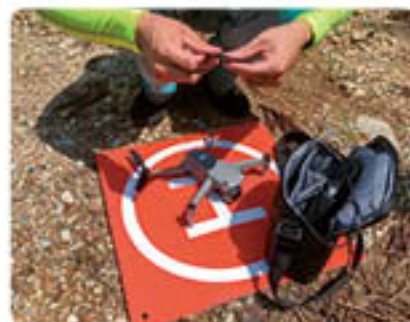
ドローンを使って測量を行う様子